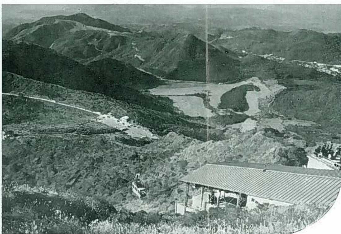
妙見岳頂上よりの展望