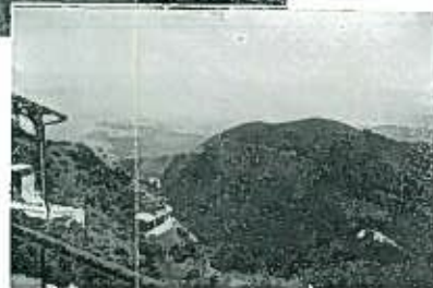
山頂より有明海の展望