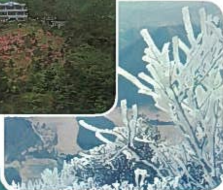
冬の霧氷 見頃12・1・2月