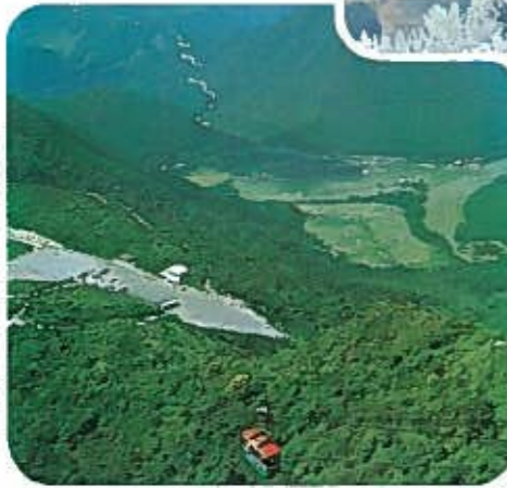
新緑の雲仙 妙見岳からゴルフ場を望む