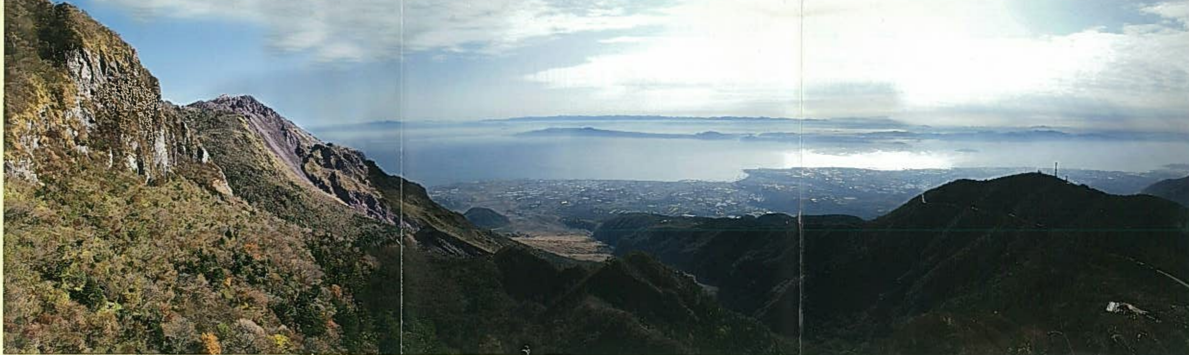
▼第2展望所から天草方面を望む